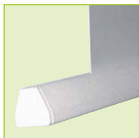
Konischer Beschwerungsstab für bündigen Abschluss mit dem Gehäuse