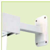
Wandabstandträger Beschreibung siehe Seite 104