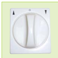
Unterputz-Drehschalter (im Lieferumfang)