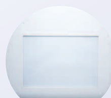
Lichtbox SLB-80 (optional)