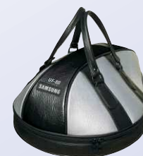
Transporttasche BAG-80 (inklusive)