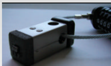
Adapter für Kensington Slot