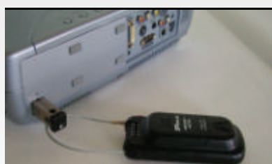
Befestigung am Projektor